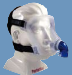
PerforMax IVA Mask

PERFORMAX IVA TOTALMASK LÄTT ATT TA PÅ. LÄTT ATT ANVÄNDA. FÖRDELARNA ÄR TYDLIGA OCH ENKLA.