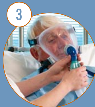
Anslut mask och ventilator