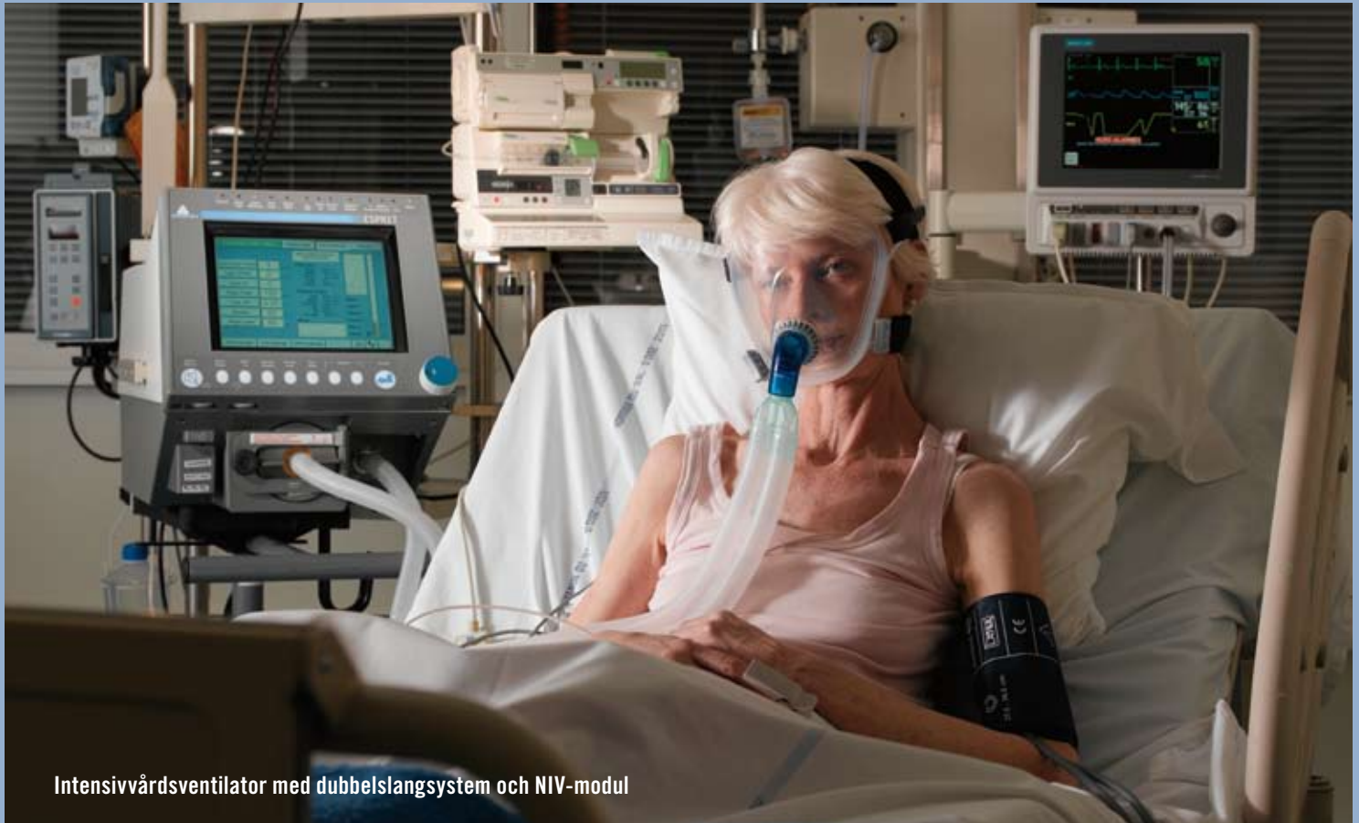
Intensivvårdsventilator med dubbelslangsystem och NIV-modul