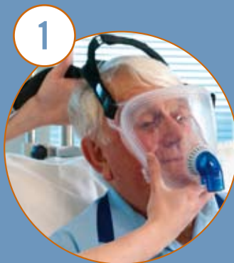
Placering av maskhållare

Inpassning av PerforMax sker i tre enkla steg som framgår av bilderna.