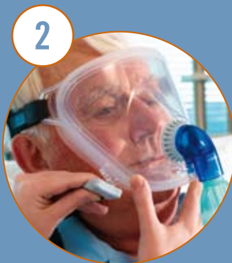
Fäst och justera maskhållaren